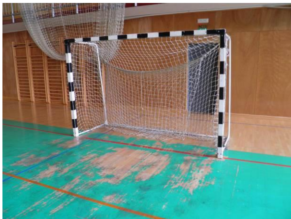
Slika 1: Prikaz poškodb športnega poda

Športna dvorana je bila grajena leta 1998. V športni dvorani potekajo številni športni dogodki poleg rekreativnega športa tudi tekme judoistov in rokometnega kluba. Zaradi številnih športnih aktivnosti, ki potekajo v športni dvorani je prišlo do obrabe in poškodovanja tal športne dvorane, ki bi jih bilo potrebno obnoviti, da bomo lahko v dvorani še naprej izvajali vse športne aktivnosti v enakem ali večjem obsegu.